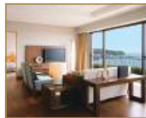
客室(ロイヤルスイートルーム/ビューバス付)