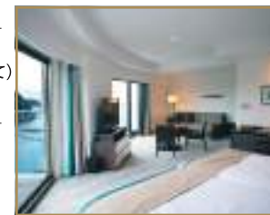
客室(オーシャンビュージュニアスイート/ビューバス付)