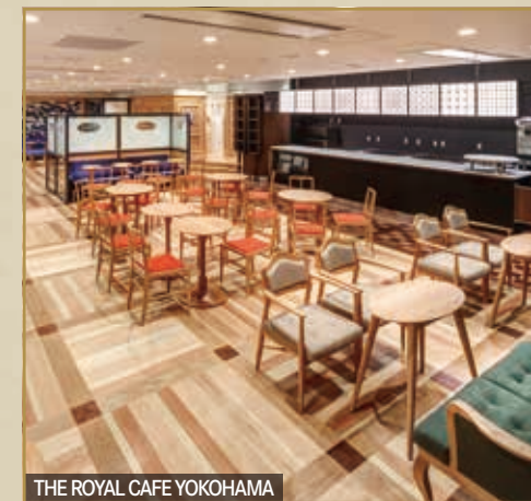
THE ROYAL CAFE YOKOHAMA

水戸岡鋭治氏によってデザインされた空間で、THE ROYAL EXPRESSの車内と同じ監修者によるコーヒー等をお楽しみいただけるカフェ。食事付き乗車プランのお客さまの旅の始まりの舞台となります。