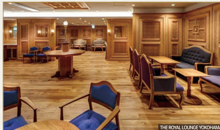
THE ROYAL LOUNGE YOKOHAMA