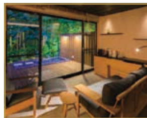
露天風呂付き和洋室(流清)