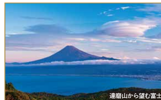
達磨山から望む富士

ニューヨーク万国博覧会で日本一の眺望に選ばれた達磨山。青々とした駿河湾と雄大な富士山の眺めは、刻を忘れるほどの絶景です。