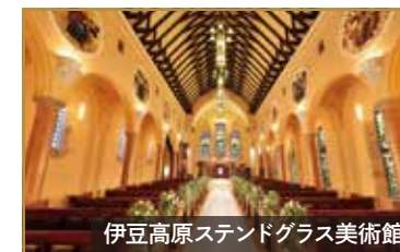
伊豆高原スタンドグラス美術館

約4000年前の噴火でできた大室山。国の天然記念物にも指定され、山頂からは富士山や相模湾に浮かぶ伊豆諸島を望め、360度の雄大なパノラマをお楽しみください。