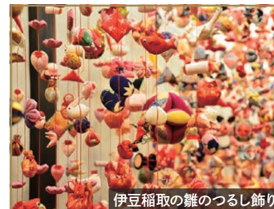
伊豆稲取の雛のつるし飾り

奇岩群が夕景と交わり格別の美しさを魅せる大田子海岸。日本の夕陽百選にも認定されている大田子海岸の夕陽は、空と海が赤く染まる幻想的な風景が広がります。