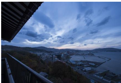
▲銀鱗荘から眺める石狩湾

北海道の海の玄関口として歴史を刻んだ小樽。その小樽でノスタルジックな浪漫を感じていただきながら特別観光を味わっていただき、さらにご宿泊いただく「銀鱗荘」では「眼下に煌めく石狩湾」と「プレミアムなディナー」でお迎えいたします。