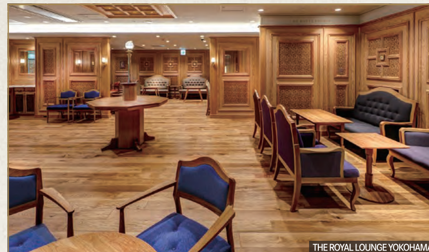
THE ROYAL LOUNGE YOKOHAMA