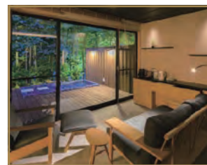
露天風呂付き和洋室(流清)