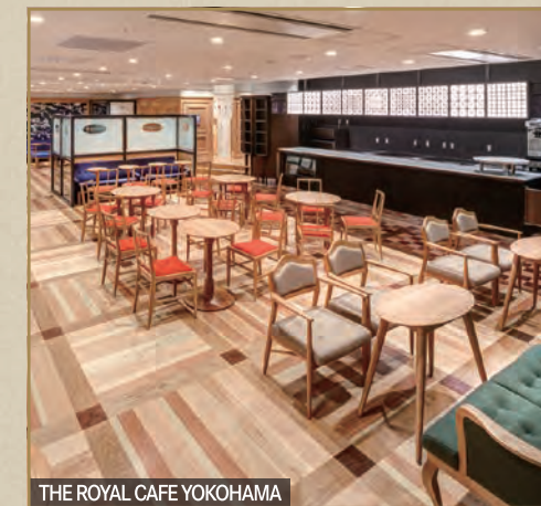
THE ROYAL CAFE YOKOHAMA

水戸岡鋭治氏によってデザインされた空間で、THE ROYAL EXPRESSの車内と同じ監修者によるコーヒー等をお楽しみいただけるカフェ。食事付き乗車プランのお客さまの旅の始まりの舞台となります。