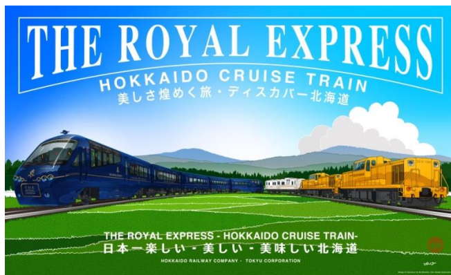
▲列車デザインイメージ©ドーンデザイン研究所(左) ／旅を彩る北海道の名所、大自然(イメージ)(右)