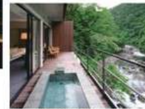
リバーウイングスイート

森に包まれた隠れ家のような特別感。全室露天風呂付きスイートルームで、解放感あふれる客室では心身ともに癒される贅沢な時間をお過ごしいたいただけます。