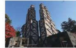
葦山反射炉

実際に大砲を製造した反射炉としては国内で唯一現存するもので、平成27年葦山反射炉を含む各地の明治日本の産業革命遺産が世界遺産に登録されました。