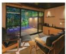
露天風呂付き和洋室(流清)