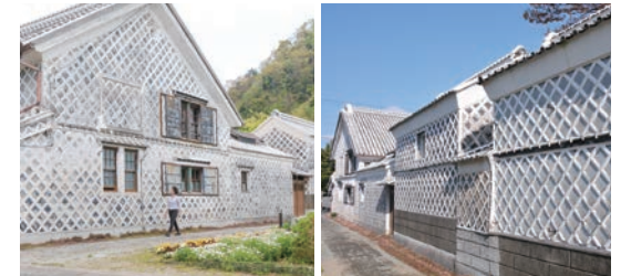
松崎のなまこ壁通り

1日目 ① 日本の原風景と昔ながらのなまこ壁が残る松崎、空と海、奇岩群が夕景と交わり格別の美しさを魅せる大田子海岸など、絶景が魅力です。