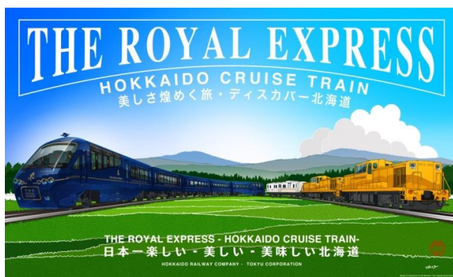
▲列車デザインイメージ©ドーンデザイン研究所(左) ／旅を彩る北海道の名所、大自然(イメージ)(右)