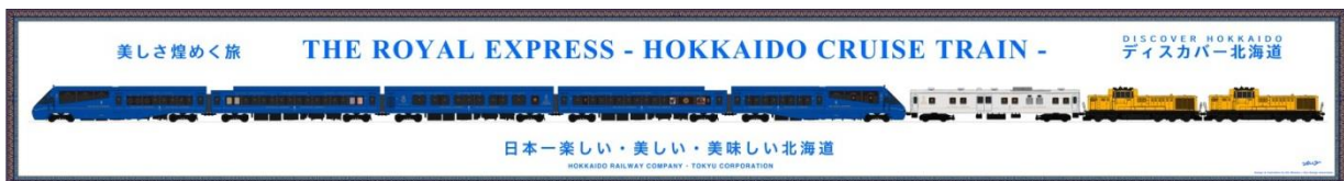
▲列車デザインイメージ©ドーンデザイン研究所

列車の動力となる機関車(JR北海道所有)は「北海道の力強く明るく元気な太陽の色・収穫の色」として「橙・オレンジ」を、列車内サービス用電力を供給する電源車(東急電鉄株式会社(以下、東急電鉄)所有)は『THE ROYAL EXPRESS』のロイヤルブルーとオレンジを粹につなぐ色」として「白・ホワイト」をメインカラーとし、北海道の自然豊かな緑の中を走る「THE ROYAL EXPRESS」のロイヤルブルーに橙、白が融合し、旅を楽しく美しく演出します。本列車の装飾は、「THE ROYAL EXPRESS」を手掛けた水戸岡鋭治氏がデザインします。