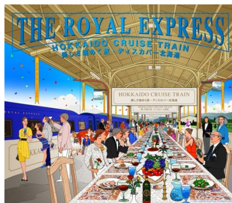
▲「THE ROYAL EXPRESS ～HOKKAIDO CRUISE TRAIN～」列車デザインイメージ(左)・駅装飾イメージ(右)