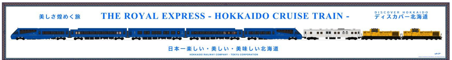
▲列車編成イメージ ©ドーンデザイン研究所