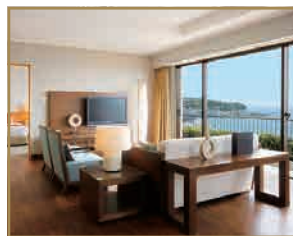
客室(ロイヤルスイート)