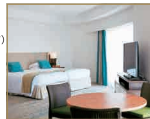
客室(オーシャンビュージュニアスイート/ビューバス付)