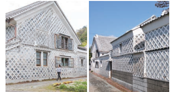
松崎のなまこ壁通り

1日目① 日本の原風景と昔ながらのなまこ壁が残る松崎、空と海、奇岩群が夕景と交わり格別の美しさを魅せる大田子海岸など、絶景が魅力です。