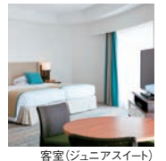
客室(ジュニアスイート)

■食事内容: 和洋折衷コース料理 100種類以上からチョイスできる和洋buffet ■食事場所: レストラン (ロイヤルクラシカルスイートはのみ部屋食可)