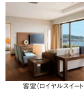
客室(ロイヤルスイート)

■食事内容: 和会席料理またはフランス料理コース 和洋バイキング (セットメニューとなる場合がございます) ■食事場所: 食事処またはレストラン