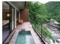
リバーウィングスイート

森に包まれた隠れ家のような特別感。全室露天風呂付きスイートルームで、解放感あふれる客室では心身ともに癒される贅沢な時間をお過ごしいただけます。