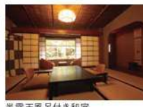
半露天風呂付き和室

竹林と数寄屋造りが情緒ある「温かくやすらぐ、気のかよう宿」。風呂は佐官仕上げなど古来の手法で造り上げています。日本建築の美と日本料理、風呂、風情、おもてなしがひとつになった宿です。