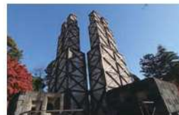
葦山反射炉

実際に大砲を製造した反射炉としては国内で唯一現存するもので、平成27年葦山反射炉を含む各地の明治日本の産業革命遺産が世界遺産に登録されました。