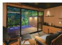
露天風呂付き和洋室(流湯)

寛ぎと安らぎを感じ、贅沢を味わえる時間と空間を備えた和モダン。和風旅館の趣を残した客室はわずか7部屋で、ゆったりとした自由な時間を提供いたします。