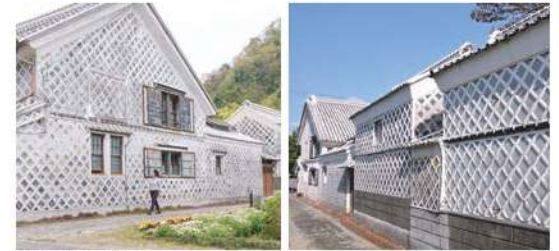
松崎のなまこ壁通り

1日目①日本の原風景と昔ながらのなまこ壁が残る松崎、空と海、奇岩群が夕景と交わり格別の美しさを魅せる大田子海岸など、絶景が魅力です。