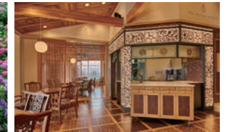
THE ROYAL HOUSE

1日目 下田ロープウェイ山頂レストラン「THE ROYAL HOUSE」の自然木を利用した上質な空間で、開国の舞台下田湾の眺望をお楽しみいただく特別席をご用意します。