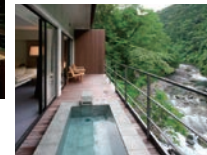
リバーウイングスイート

森に包まれた隠れ家のような特別感。全室露天風呂付きスイートルームで、解放感あふれる客室では心身ともに癒される贅沢な時間をお過ごしいただけます。