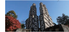
韮山反射炉

実際に大砲を製造した反射炉としては国内で唯一現存するもので、平成27年韮山反射炉を含む各地の明治日本の産業革命遺産が世界遺産に登録されました。