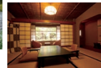
半露天風呂付き和室

竹林と数寄屋造りが情緒ある「温かくやすらぐ、気のかよう宿」。風呂は佐官仕上げなど古来の手法で造り上げています。日本建築の美と日本料理、風呂、風情、おもてなしがひとつになった宿です。