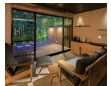
露天風呂付き和洋室(流清)

寛ぎと安らぎを感じ、贅沢を味わえる時間と空間を備えた和モダン。和風旅館の趣を残した客室はわずか7部屋で、ゆったりとした自由な時間を提供いたします。