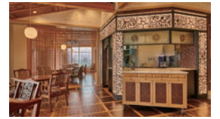
THE ROYAL HOUSE