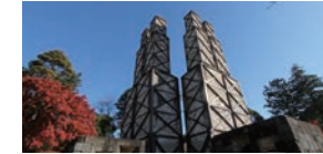
葦山反射炉

実際に大砲を製造した反射炉としては国内で唯一現存するもので、平成27年葦山反射炉を含む各地の明治日本の産業革命遺産が世界遺産に登録されました。