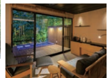
露天風呂付き和洋室(流清)

寛ぎと安らぎを感じ、贅沢を味わえる時間と空間を備えた和モダン。和風旅館の趣を残した客室はわずか7部屋で、ゆったりとした自由な時間を提供いたします。