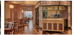
THE ROYAL HOUSE