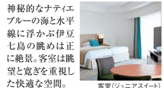
客室(ジュニアスイート)

■食事内容: ☑和洋折衷コース料理 ☑100種類以上からチョイスできる和洋ブッフェ ■食事場所: ☑レストラン (ロイヤルクラシカルスイートは☑のみ部屋食可)