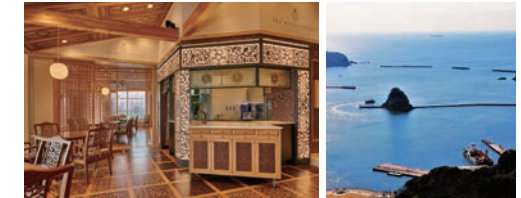
THE ROYAL HOUSE

1日目 下田ロープウェイ山頂レストラン「THE ROYAL HOUSE」の自然木を利用した上質な空間で、開国の舞台下田湾の眺望をお楽しみいただく特別席をご用意します。