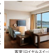
客室(ロイヤルスイート)

青い海と空、日常の喧騒を忘れられる豊かな自然。ホテルの目の前に広がる白い砂浜はまるでプライベートビーチ。