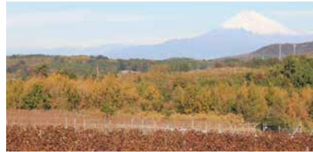
中伊豆ワイナリーシャトー-T.S

小高い丘に広がるブドウ畑の中に立つ中伊豆ワイナリーシャトー-T.S。雄大な自然と富士山を眺めながら、丁寧に育てられたブドウを使った芳醇なワインをお楽しみいただけます。