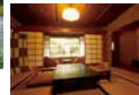
半露天風呂付き和室

竹林と数寄屋造りが情緒ある「温かくやすらぐ、気のかよ宿」。風呂は佐官仕上げなど古来の手法で造り上げています。日本建築の美と日本料理、風呂、風情、おもてなしがひとつになった宿です。