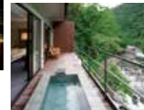
リバーウイングスイート

森に包まれた隠れ家のような特別感。全室露天風呂付きスイートルームで、解放感あふれる客室では心身ともに癒される贅沢な時間をお過ごしいただけます。