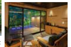
露天風呂付き和洋室