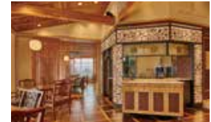
THE ROYAL HOUSE

2日目 8月開業予定の下田ローブウェイ山頂レストラン「THE ROYAL HOUSE」の自然木を利用した上質な空間で、開国の舞台下田湾の眺望をお楽しみいただく特別席をご用意します。