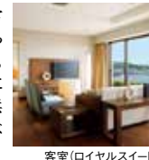
客室(ロイヤルスイート)

青い海と空、日常の喧騒を忘れられる豊かな自然。ホテルの目の前に広がる白い砂浜はまるでプライベートビーチ。