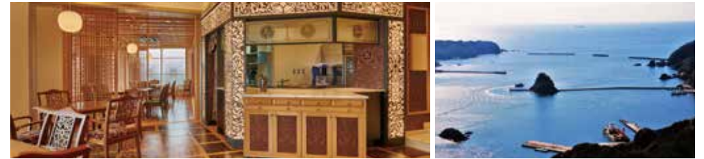
THE ROYAL HOUSE

1日目 8月開業予定の下田ロープウェイ山頂レストラン「THE ROYAL HOUSE」の自然木を利用した上質な空間で、開国の舞台下田湾の眺望をお楽しみいただく特別席をご用意します。