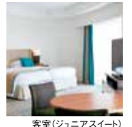
客室(ジュニアスイート)

神秘的なナリエブルーの海と水平線に浮かぶ伊豆七島の眺めは正に絶景。客室は眺望と寛ぎを重視した快適な空間。