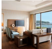
客室(ロイヤルスイート)

青い海と空、日常の喧騒を忘れられる豊かな自然。ホテルの目の前に広がる白い砂浜はまるでプライベートビーチ。