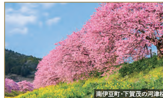
南伊豆町・下賀茂の河津桜

波の浸食作用により形成された海の洞窟。直径50メートル程ある天窓からは太陽の光が差し込み、青く透き通る海水の煌めくさまは神秘的な美しさを誇ります。