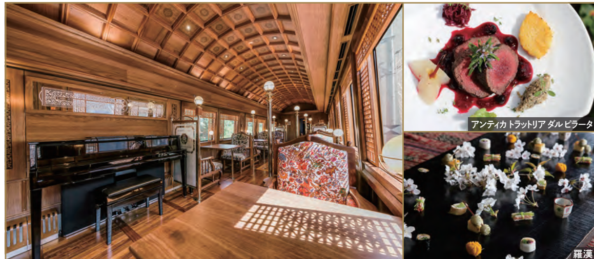
アンティカトラットリア ダルピラータ