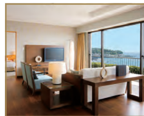
客室(ロイヤルスイート)