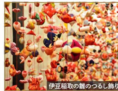
伊豆稲取の雛のつるし飾り

奇岩群が夕景と交わり格別の美しさを魅せる大田子海岸。日本の夕陽百選にも認定されている大田子海岸の夕陽は、空と海が赤く染まる幻想的な風景が広がります。