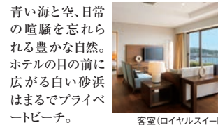
客室(ロイヤルスイート)