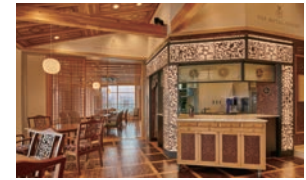
THE ROYAL HOUSE

2日目 8月開業予定の下田ローブウェイ山頂レストラン「THE ROYAL HOUSE」の自然木を利用した上質な空間で、開国の舞台下田湾の眺望をお楽しみいただく特別席をご用意します。